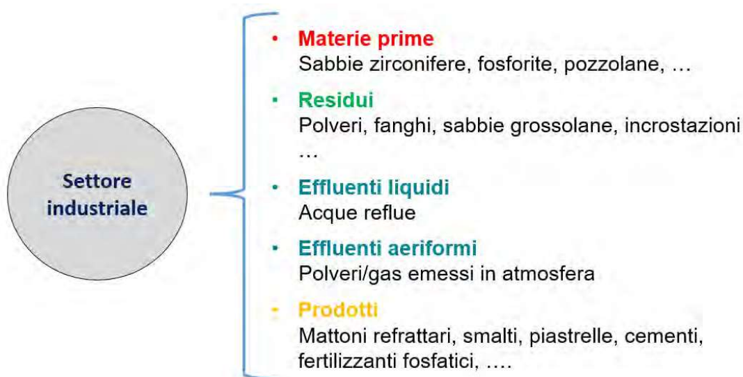
Figura 4 Schematizzazione della metodologia per l'individuazione delle matrici da analizzare